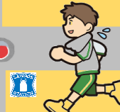
矢橋帰帆島・琵琶湖博物館

東山道(とうさんどう)記念公園 宿場の遺跡や東山道の道路跡が周辺で発見された為、記念公園が作られた。遊具はないが、春には桜が咲き、花壇は綺麗に手入れされているので、ホッと一息つける場所です。 また、円筒分水工があり、農業用水を分配する施設で