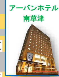
アーバンホテル南草津